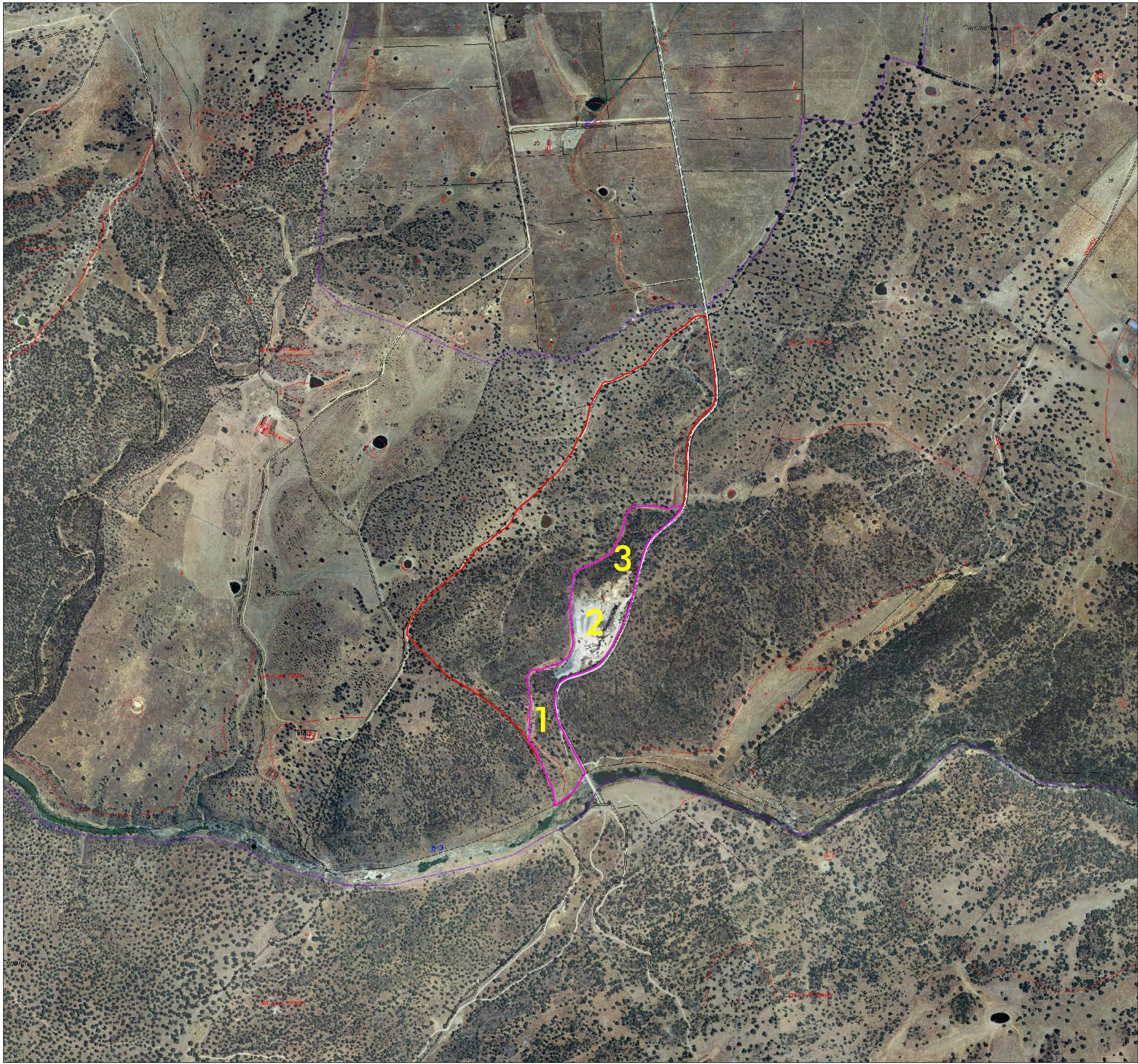
CAMINO DE ACCESO A LA FINCA