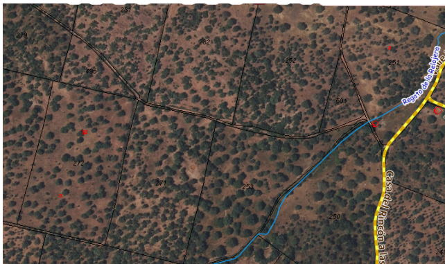
Ortofoto actual del PNOA en información cartográfica catastral.