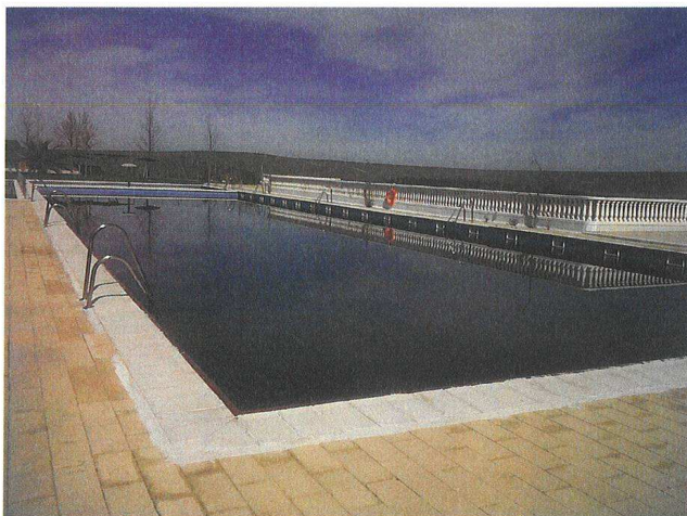
Vaso 1 (Piscina recreativa):