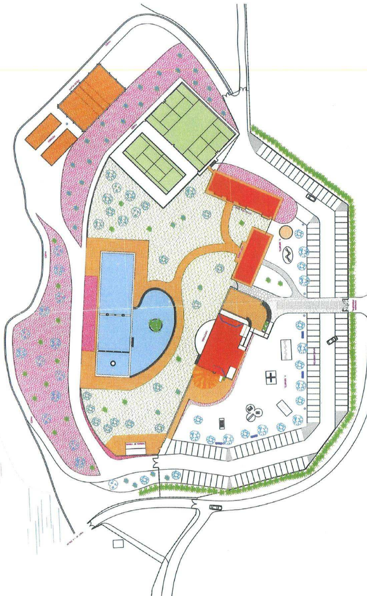
ÁREA DEL GUADIPARK