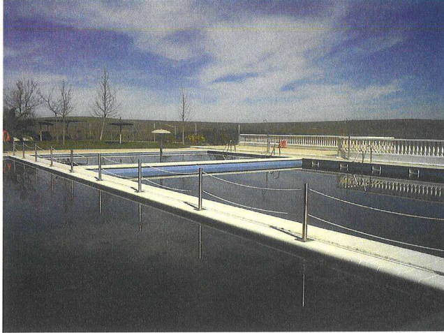
Vaso 2 (Piscina con Seta):