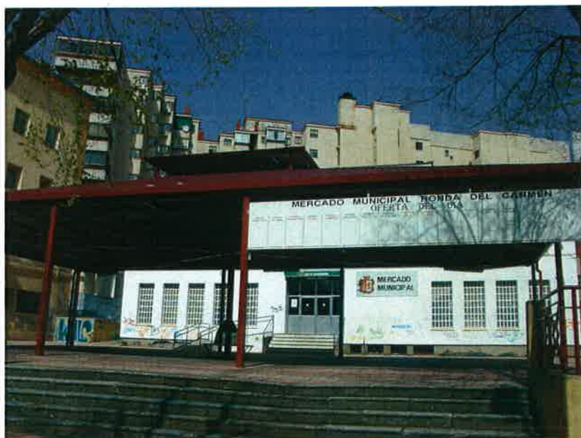
Nivel de puestos 0 (baja)