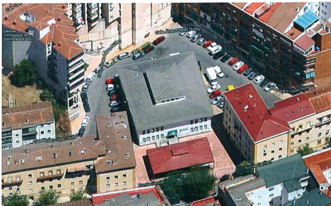
Vista aérea estado actual.