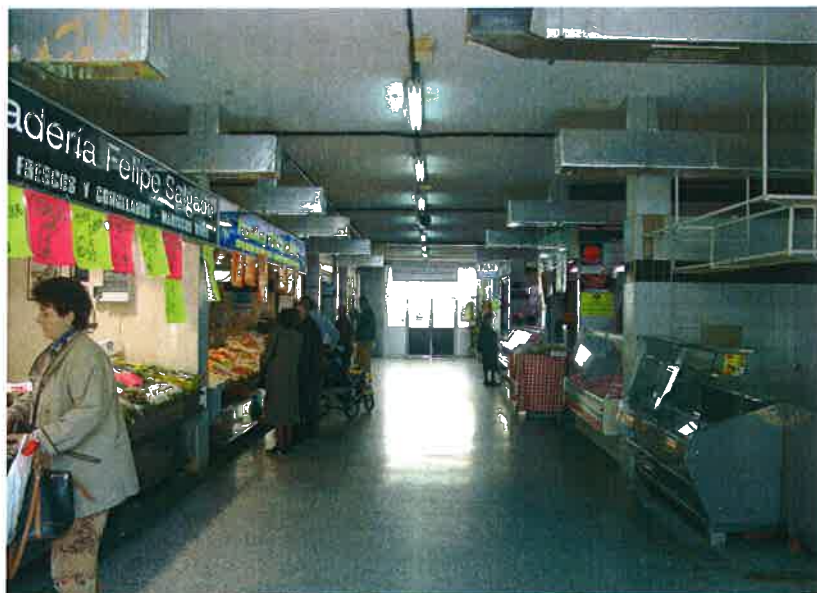
Nivel de puestos I (primera) + ático lucernario.