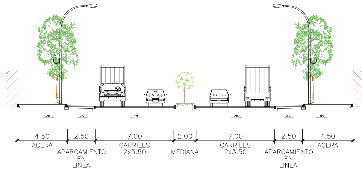
SECCION TIPO ESCALA: 1/200